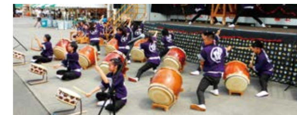
理研納涼祭 県立駿河総合高校和太鼓部の演奏の様子

日軽金グループでは、地域住民の皆さまに工場を知っていただくとともに日頃の感謝を伝えるため、場内イベントを開催しています。社員が屋台、ゲーム、抽選会、パズル、工場見学などを行い、また、地元学校から和太鼓やチアリーディングのチームに参加いただくなど、近隣住民の皆さまと交流する貴重なイベントとなっています。