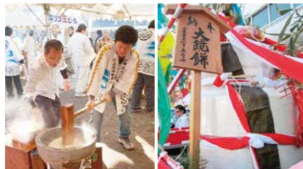
大鏡餅つきの様子

愛知県稲沢市の尾張大国霊神社にて行われる「国府宮はだか祭」は1200年以上の歴史を持つ由緒ある祭りです。日本軽金属㈱名古屋工場では、毎年、地域より奉納される大鏡餅つきへの従業員参加や奉納パレードへの協力など、地域を通じて祭りに参加しています。さらに祭りのクライマックスである「儼追神事」の当日は、警備や救護のために敷地を提供するなど、地域に根差した祭りを大切にしています。