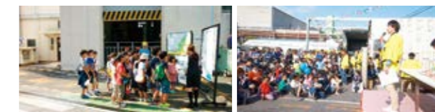
日軽祭での工場見学の様子