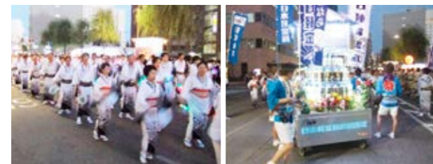
大民謡流しの様子

参加者数約1万4千人を誇り、日本最大級の民謡流しのひとつといわれる新潟県新潟市「新潟まつり」大民謡流しに、毎年日軽金グループから約250名が参加しています。日軽新潟㈱製のアルミ樽で飾り付けしている万燈とともに、揃いの浴衣で息の合った踊りを披露しています。