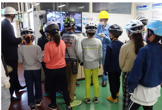
日軽蒲原押出工場のショールーム見学

日本軽金属グループでは、今後も地域の皆さまから愛される企業を目指して、グループの持ち味を生かし、各種イベントや交流機会の創出に注力してまいります。