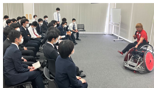
4月27日「日本軽金属グループ2023年度総合職新入社員研修」講演

日本軽金属グループは、今後も当グループの経営方針および社会貢献方針に則り、障がい者スポーツの更なる発展に寄与するとともに、健全な社会貢献活動を目指してまいります。